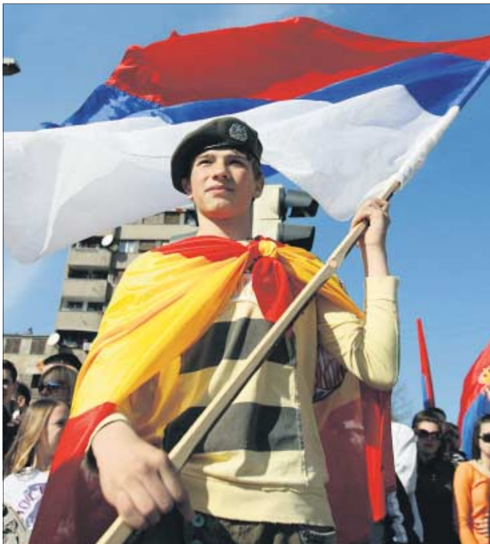
Demonštrácie Srbov proti osamostatneniu Kosova pokračovali včera na území Srbska, Bosny a Hercegoviny i v samotnom Kosove. Na fotografii z etnicky rozdelenej Kosovskej Mitrovice demonstrant, zahalený v španielskej vlajke, máva srbskou zástavou. Španielsko je jednou zo štyroch krajín EÚ odmietajúcich uznať samostatné Kosovo.

zisku hlasov KSČ v ďalších voľbách, plánovaných na máj 1948. Podľa niektorých histo-