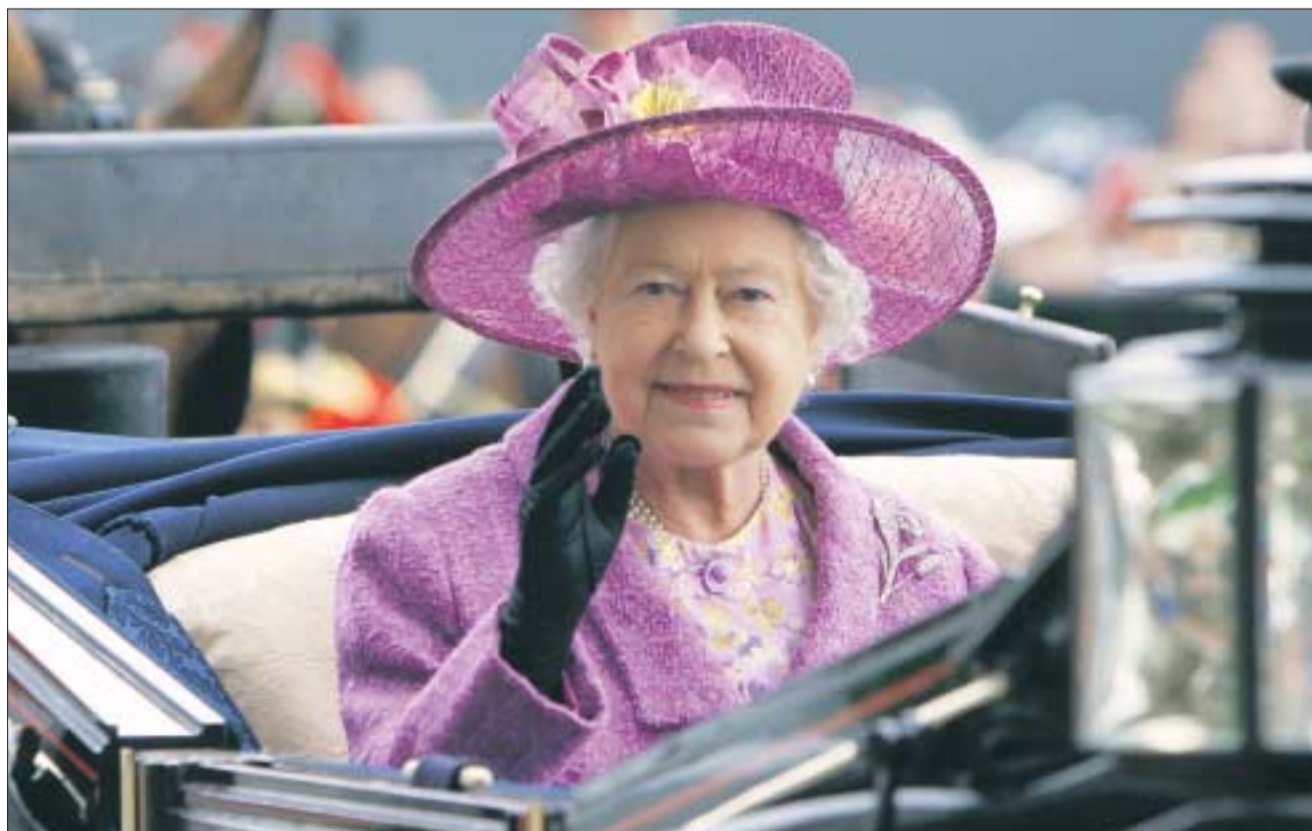
Kráľovná príde na jeseň. Britská panovníčka Alžbeta II., na archívnej fotografii z kráľovských dostihov v Ascote, sa počas svojej návštevy nezastaví len v Bratislave, pozrie si aj nejakú inú časť Slovenska.